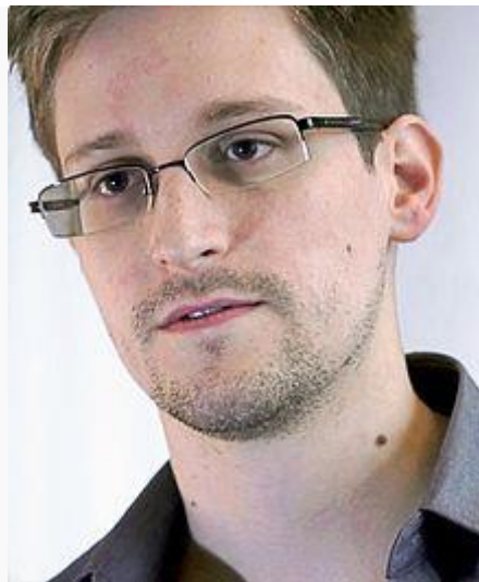
Edward Snowden, 2013

Edward Snowden flog am 20. Mai 2013 von Hawaii nach Hongkong, wo er um Asyl bat. Zwischen dem 1. Juni und dem 6. Juni gab Snowden in Hongkong den Guardian -Reportern Glenn Greenwald und Ewen MacAskill und der Dokumentarfilmerin Laura Poitras diverse Dokumente der NSA und ein Video-Interview, welches am 9. Juni veröffentlicht wurde. [1] In dem Interview sprach er über seine Motivation und über die Dokumente, welche er besitzt. [2]