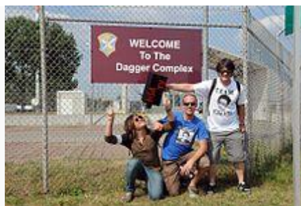
Demonstranten vor dem Dagger Complex (Juli 2013)